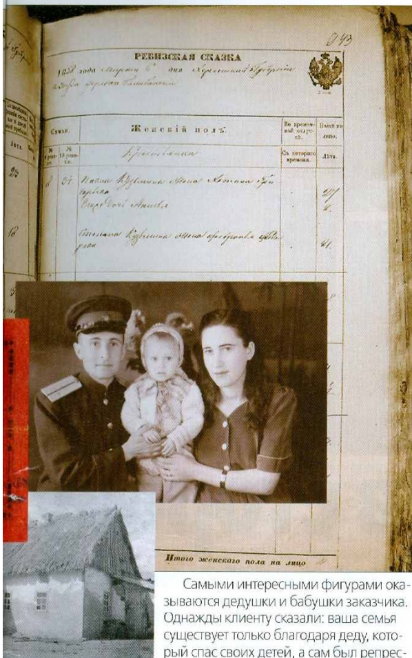
Итого осеннего поля на лицо

Найти и получить нужные архивные документы самостоятельно — дело, на первый взгляд представляющееся весьма хлопотным и даже невозможным. Начнем с того, что данные о рождении, смерти и прочая информация хранятся в архивах московских загсов 75 лет. В не-